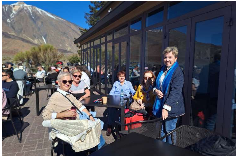
Wulkan Teide, Teneryfa

ne, a uczestnicy zyskali motywację do dalszego rozwoju.