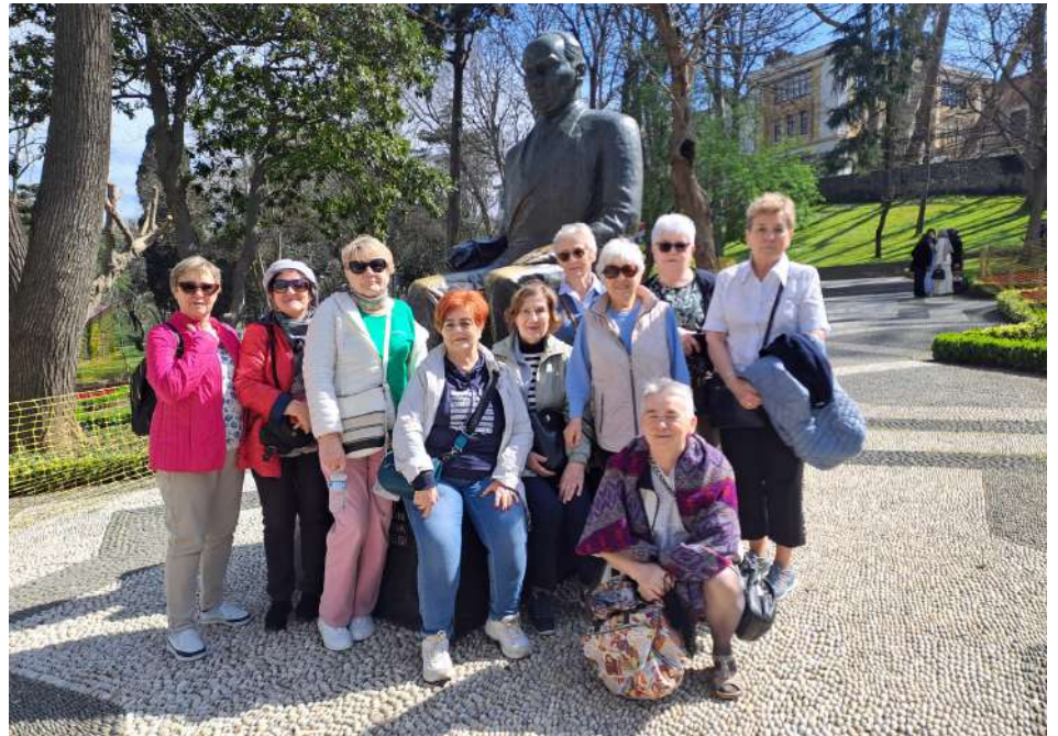
Park pałacu Topkapi z pomnikiem prezydenta Atatürka, Stambuł

Program Erasmus+ odegrał ogromną rolę w rozwoju naszej organizacji. Dzięki udziałowi w projekcie Radomszczański Uniwersytet Trzeciego Wieku stał się bardziej nowoczesny, otwarty i aktywny na arenie międzynarodowej. Wzrosły kompetencje członków i kadry, pojawiły się nowe pomysły na działania edukacyjne i społecz-