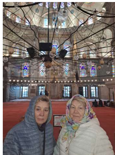
Błękitny Meczet, Stambuł