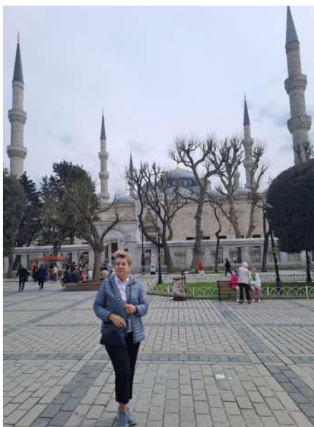
W tle Błękitny Meczet, Stambuł

Pierwszym etapem projektu były wyjazdy kadry do Grecji. Pozwoliły one zdobyć nowe kompetencje oraz inspiracje do dalszych działań. Szczególne znaczenie miało rozwijanie umiejętności językowych, przede wszystkim w zakresie języka angielskiego, który stał się